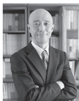
▲「行列のできる法律相 談所」などテレビでも 有名な菊地弁護士

まちづくり推進課 〒910-0592 坂井町下新庄1-1 ☎50-3017 FAX 66-4837 machizukuri@city.fukui-sakai.lg.jp