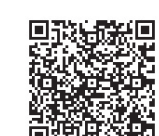
特定疾患特別助成金