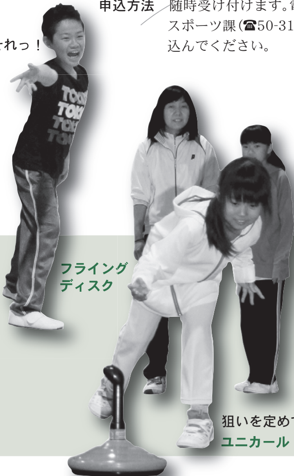
フライング ディスク