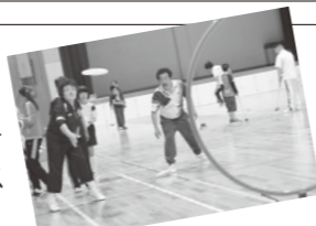
▲フライングディスク