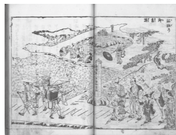
▲享和3年(1803)に刊行された親鸞・蓮如に関する聖地巡礼のためのガイドブック。『二十四輩順拝函会』から「柘植之御旧跡」