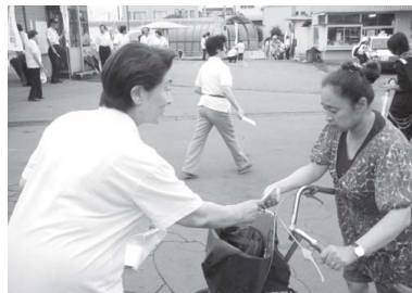
▲駅前などで街頭啓発を実施