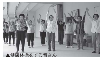
▲健康体操をする皆さん