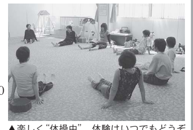
▲楽しく「体操中」。体験はいつでもどうぞ

健康づくりグループを紹介します はつらつミセスの会 健康に関する勉強会や体操などを行います。ハツラツとした女性でいられるよう、楽しく活動しませんか。 と き 第1火曜日 9:30~11:00 と ころ 坂井健康センター 会 費 年会費2,000円 ☎健康長寿課 ☎50-3040