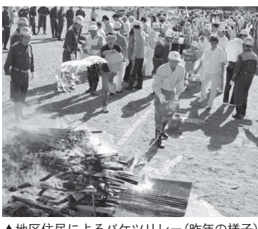
▲地区住民によるバケツリレー(昨年の様子)

10月18日(日) 6時30分〜9時30分 ※少雨決行 ところ 三国西小学校 訓練内容 非常招集訓練、情報伝達訓練、避難訓練、濃煙体験、医療救護訓練、被害状況調査