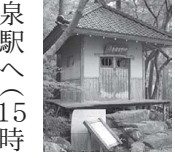
▲風情ある佇まいの芭蕉道

奥 の細道の旅の途中で、芭蕉が立ち寄った医王寺に今も残る「忘れ杖」や句碑をたどりながら、秋の山中路を歩きます。