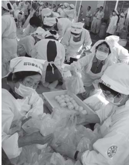
▲市赤十字奉仕団による炊き出し(昨年の様子)

災 害対策基本法および坂井市地域防災計画に基づき、防災関係機関が協力して迅速・的確に応急対策が実施できるよう、地震発生を想定した総合防災訓練を行います。倒壊家屋からの救出訓練や、破損した堤防の応急復旧訓練などを行うほか、防災訓練体験ゾーンも設置します。