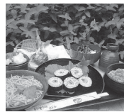
▲新そばづくしの屋敷

②あわら市をぶらぶら散歩: 「和」で楽しく!美しく! あ わらでこの日しか体験できない内容です。新そば粉を使っておいしいスイーツ作りを伝授。また、室内インテリアとして人気の「苔玉」の作り方もお教えします。