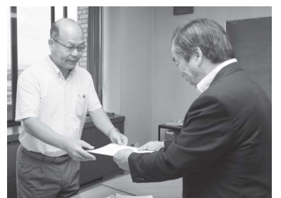
▲市長から新たに委嘱状を交付