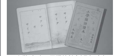
▲小学1年生の国語教科書(昭和8年)