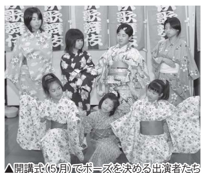
▲開講式(5月)でポーズを決める出演者たち

大 人の役者にも引けを取らない演技で毎年大好評の「まるおか子供歌舞伎」。本番の舞台で最高の演技を披露しようと、子供たちは6月から稽古に励んできました。今回の演目は、「鳥辺山心中」。旗本と遊女の悲恋物語を描いた名作です。また、美しい舞で観客を魅了する舞踊も、見応え十分です。名曲「お祭り」に合わせ、4人が舞を披露。火消しの鷹頭や芸者の風情を、粋に、そしてしっかりと表現します。 今回、歌舞伎に出演するのは、小学3年生から6年生までの8人。厳しい稽古で磨かれ、繰り広げられる迫真の演技を、ぜひ会場で