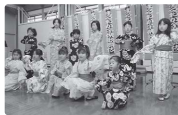
▲初顔合わせは5月10日。晴れの舞台に胸を膨らませる出演者ら

歌舞伎役者に引けを取らない演技で毎年大好評の「まるおか子供歌舞伎」。11月8日(土)の公演で最高の演技を披露しようとして、子供たちが6月から練習に励んできました。 今回の演目は、「加賀見山旧錦絵」。お家騒動を発端としたあだ討ち劇を、情感たつぷりに演じます。 また、美しい舞で観客を魅了する歌舞伎舞踊も、見応え十分。「あやめ」と「浅妻船」をあでやかに披露します。 今回出演するのは、小学2年生から6年生までの10人、全員が女の子です。華麗な舞台に、どうぞご期待ください。