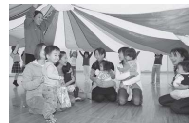
▲親子同士の交流が広がるつどいの広場。在園児との触れ合いも