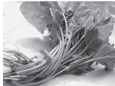
▲まぼろしの野菜、白茎ごぼう

申込方法 電話で下記まで 市農業振興協議会(春江総合支所産業課内) ☎51-9405