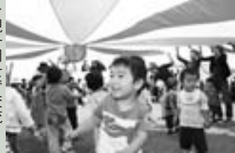
▶親子同士で交流(昨年の様子)