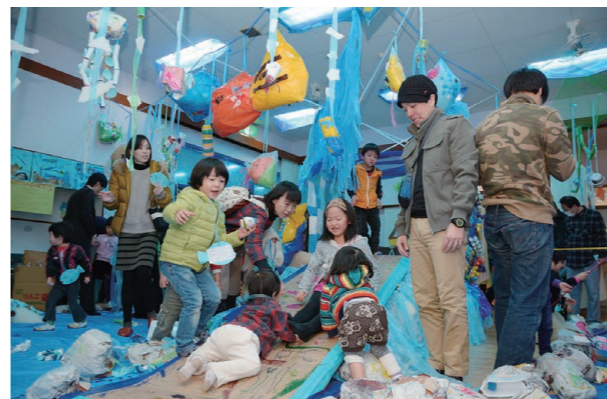
▲段ボールや牛乳パックで作られた「にじいろのさかなの滑り台」は子どもたちに大人気

絵本『にじいろのさかな』の世界を再現した「一日限りの美術館」が、丸岡町の緑幼稚園で開かれました。年明けから2～5歳の園児48人が、段ボールや新聞紙、卵のパックなどを使ってホールを装飾。クラスの部屋には、これまでの描いた絵画や粘土などの制作物も多数展示され、来場者は子どもたちの豊かな表現力と創造力に目を見張っていました。