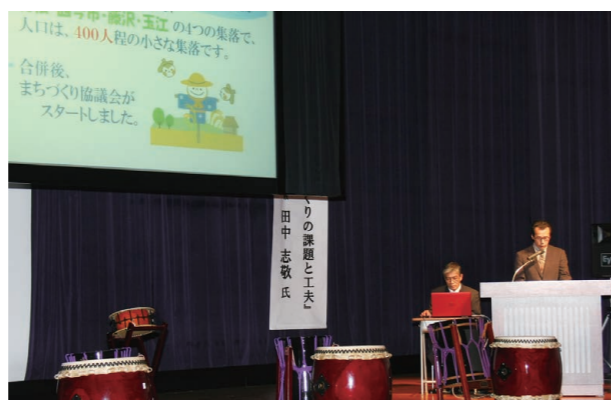
▲三国東部、三国木部、竹田、大石地区の4つの協議会が自分たちの活動事例を発表

幼年消防クラブによる防火豆まきが、三国松涛保育園で行われました。赤鬼・青鬼に変装した嶺北三国消防署員が、先生を捕らえて園児たちに火遊びを強要。はじめは怖がっていた3～5歳の園児ら78人は、勇気を出して鬼に豆を投げつけて先生を救い出しました。鬼が退散すると園児らは、「火遊びは絶対しません」と大声で防火の誓いをしました。