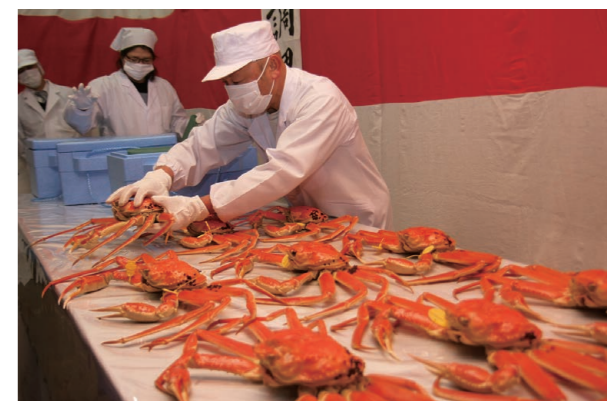
▲調理台で冷ました後に越前がにを丁寧に箱詰めしていく

まちの話題が満載の「フォーカス」は、市のホームページ（ http://www.city.fukui-sakai.lg.jp/ ）からもご覧いただけます。ホームページでは「ホット」な話題を随時公開。また、上記以外の話題も紹介しています。