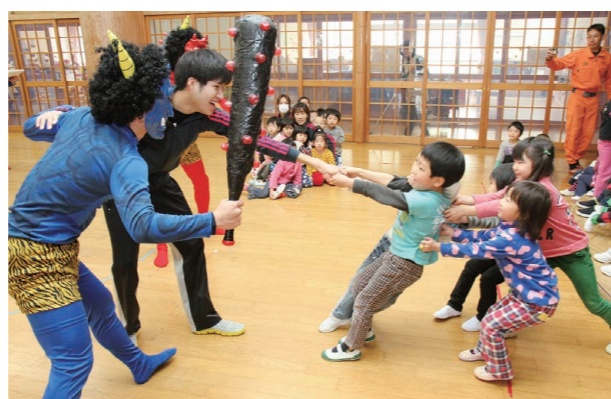
▲鬼に捕らわれた先生を助けようと、必死に手を引く園児たち

まちの話題が満載の「フォーカス」は、市のホームページ（ http://www.city.fukui-sakai.lg.jp/ ）からもご覧いただけます。ホームページでは“ホット”な話題を随時公開。また、上記以外の話題も紹介しています。