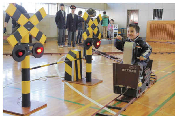
▲通り過ぎるときには遮断機が下りて踏切が光る。細部にまでこだわった作り込みに乗客も思わず笑顔

春江中子ども教室サタボラ倶楽部の子どもたちや市内の小学生が、春江工業高校の生徒たちが制作した電気自動車やロボットを楽しみました。春工生が授業で学んだ知識やアイデアを詰め込んだブースは全部で30箇所。機械の精密な作りはもちろん、妖怪ウォッチを取り入れたラジコンなどにも関心が集まり、笑い声や歓声が飛び交っていました。