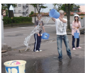
▲地域で行う防災訓練。連帯感の形成と防災の知識を養う

災害はいつ、どのようなものが来るか分かりません。災害が来てからどうしようかと考えるのでは対応が遅れて、被害が拡大してしまいます。そのため、日頃からの防災活動で備えることが必要です。例えば、定期的な防災講座を開くことによる防災知識の普