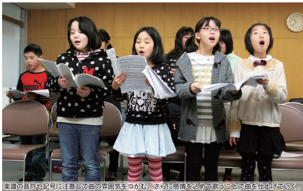
楽譜の音符や記号に注意して曲の雰囲気をつかむ。さらに感情を込めて歌うことで曲を仕上げていく。