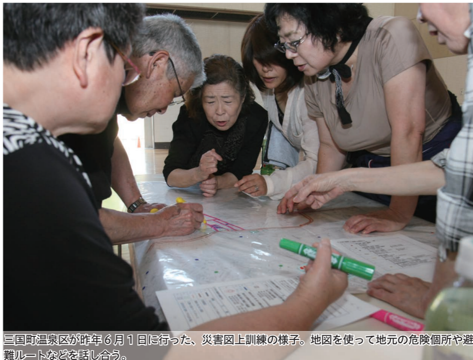
三国町温泉区が昨年6月1日に行った、災害図上訓練の様子。地図を使って地元の危険箇所や避難ルートなどを話し合う。