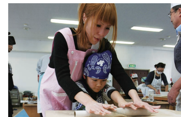
▲ラップの芯でそば粉を延ばす親子。ラップの芯は十分硬く、潰れることなく使用できた