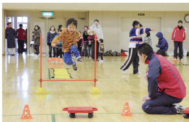
▲障害物を跳んで走ってまた跳んで！運動能力や運動神経を向上させるトレーニングにも笑顔で参加

2月14日に設立された総合型地域スポーツクラブ「スマイル輪ING」が、三国体育館で体験フェスタを行いました。市内外の子どもからお年寄りまで約250人が参加し、運動能力向上トレーニングや健康フィットネス、ファミリーバドミントン、ユニカールなどのニュースポーツを体験。会場では、会話しながら運動を楽しむ親子の姿も多く見られました。