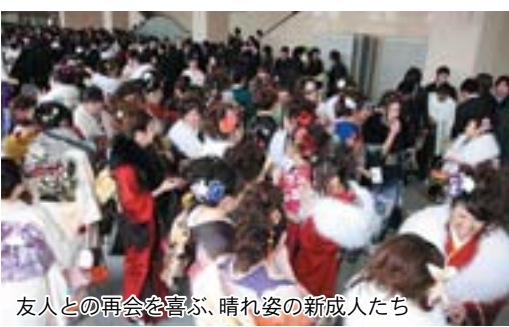
友人との再会を喜び、晴れ姿の新成人たち