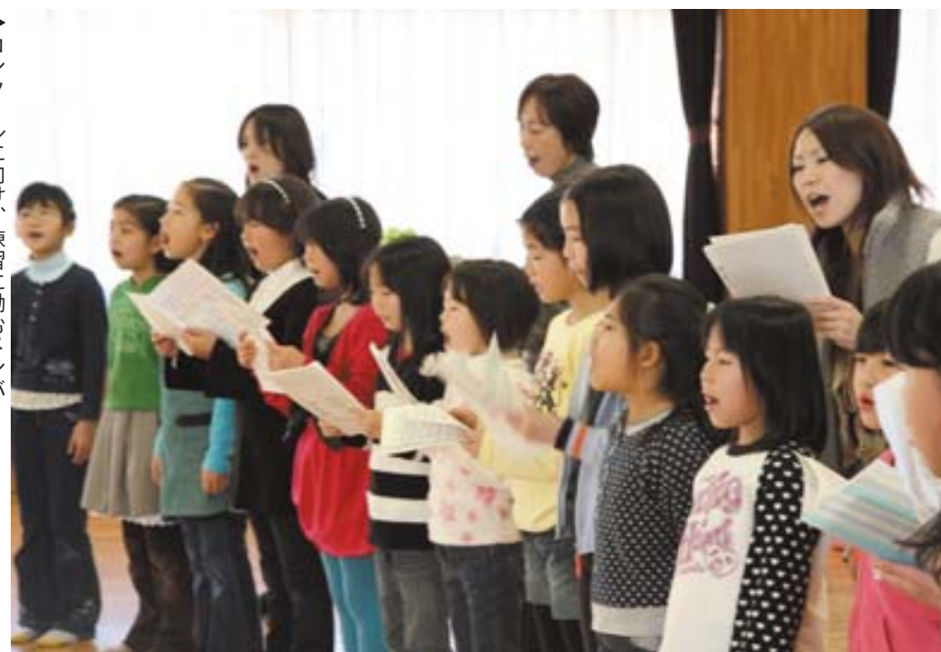
▶コンクールに向け、練習に励むメンバー

練習場のドアを開けると飛び込んでくる、元気な歌声と子供の生き生きとした笑顔。扉の「境界線」に足を一歩踏み入れると、その美しいハーモニーにつられ、一緒に口ずさみたくなる。見ている人の心もうきうきさせるコーラスグループ、それが「ボッカ・ベルラさかい」だ。