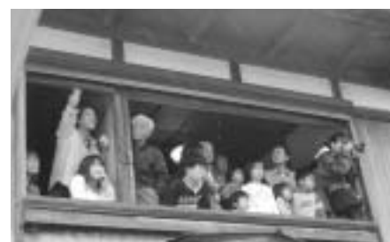
▲2階の窓はすべて開放。家族や親戚の皆さんが集まって、巡行を“観戦中”。