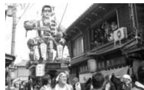
▲坂井市誕生記念の山車「桃太郎」の引き手は一般公募。三国以外に丸岡、坂井、春江などから約100人の参加がありました。

北陸三大祭りの一つといわれている「三国祭」が、5月19日から21日まで行われました。中日の20日には、祭り最大の呼び物である山車の巡行が行われ、町中が勇壮な雰囲気になりました。 三国祭は、江戸時代から続く三国神社の祭礼です。毎年、当番区の人たちが制作した武者人形を乗せた山車を引くのが見ものとなっています。 坂井市誕生後初めての開催となった今年の三国祭には、記念の山車が奉納されました。また、県の無形民俗文化財に指定されたこともあり、山車の巡行を一目見ようと、小雨が降りしきっていたにも関わらず大勢の見物客が訪れました。 正午ごろ、高さ6メートルにも及ぶ巨大な武者人形を乗せた山車が7基、三国神社前に結集。子供囃子方による太鼓の競演の後、順番に町中に繰り出し、人々の目を引いてました。