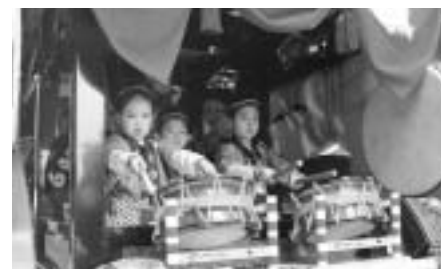
▲「アーイーヤ」。笛や三味線に合わせてのおはやし。何カ月も練習を積みました。