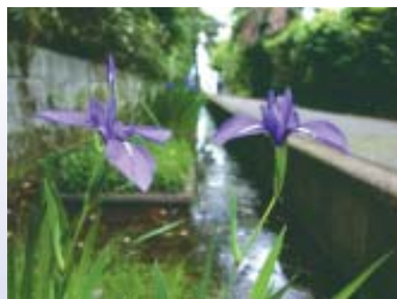
『水路の主 - 杜若 -』(春江町正蓮花)

気ぜわしい世の中。背伸びして生きるのも悪くはないけれど、時にはこんなふうに――目線を少しだけ下げた。気づかなかった幸福がきっと、見えてくるよ。