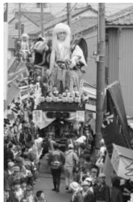
▲山車が細い路地を通るときは、露店の軒(屋根)を上げてくれます。