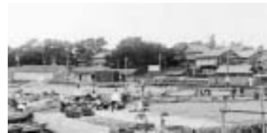
▲三国港駅 昭和中期