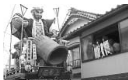
▲「わ～、電線切れんかな」。家の軒先をかすめながら、山車は雄雄しく進みます。