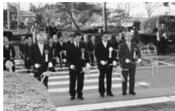
▲テープカットをする旧4町長

た」と述べ、「坂井郡が一つの市となり一体となるしかない。そのために、地域自治区の平等の発展を目指したい」と語気を強めていました。 また、三国・丸岡・春江町の各総合支所でも開庁式が開かれ、市として業務を開始しました。