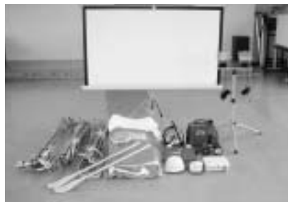
▲災害に備え、資機資材を充実

のつね安全安心推進協議会(丸岡町)は、自治総合センターのコミュニティ助成で防災備品などを購入。備品は、救命ボートや救命員、テント、プロジェクターなど10種。救助活動に必要なものや、防犯・防災に関する啓発を行うため教育器具を整備しました。