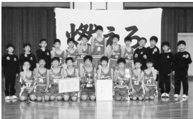
▲初優勝し、笑顔でガッツポーズの春江男子バスケットボールスポーツ少年団