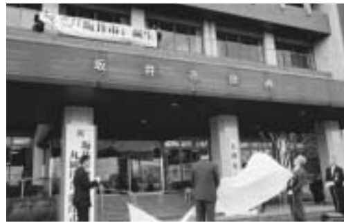
▶銘板の除幕を行う丸岡総合支所