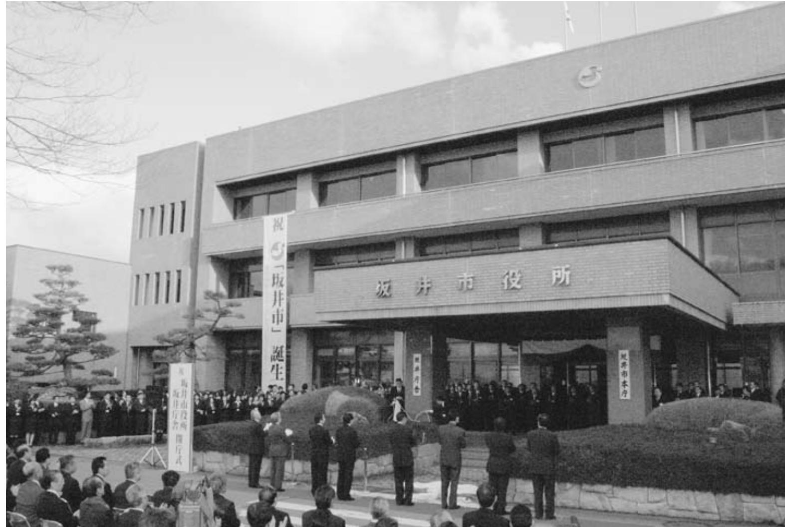
坂井市のスタートを祝い、喜びに満ちた坂井庁舎

坂井市としてスタートを切った3月20日(月)、市役所の開庁式が開催されました。式は、本庁となる坂井庁舎や各町の総合支所庁舎で行われ、新たな船出を祝いました。