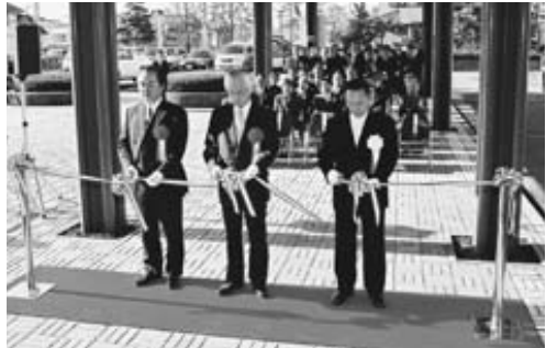
▶テープカットをし、業務を開始する春江総合支所