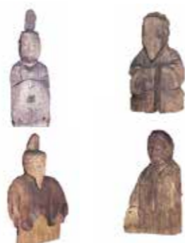
4, 大湊神社木造神像