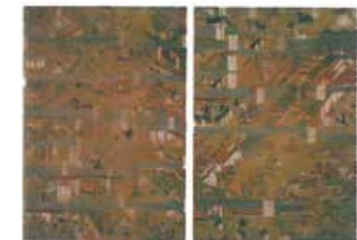
1, 絹本着色聖徳太子絵伝「極楽・北陸の浄土美術」より転載

2, 上半身裸身の童形の聖徳太子像です。像高69cm、寄木造り、桧材の仏像です。製作年代は鎌倉~南北朝時代と考えられています。