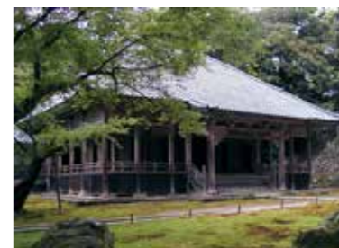
3, 瀧谷寺 本堂・観音堂・方丈および庫裏・山門（鐘楼門）・新殿（客殿）