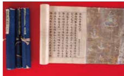
3. 卷子本浄土三部経