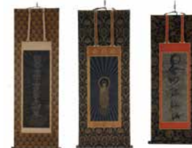
2, 寄安道場関連資料