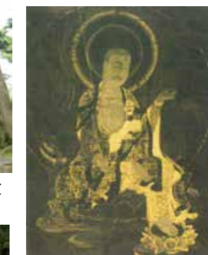
4, 絹本着色地藏菩薩像 「古利 瀧谷寺」より転載