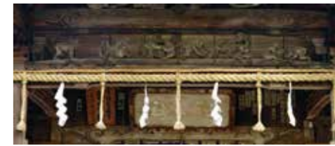
4, 三國神社拜殿向拝の群猿像