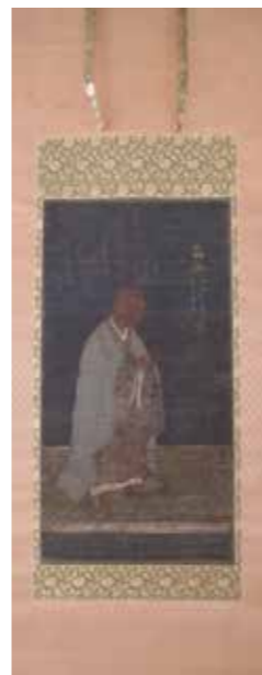
1. 絹本著色他阿上人真教像

1, 踊り念仏で有名な時宗の二祖、他阿真教の肖像です。鎌倉時代の作品で、現存する最古の上人像です。