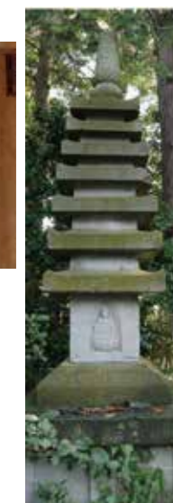
7. 称念寺石造多層塔