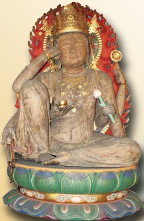
観音院木造如意輪観音菩薩坐像