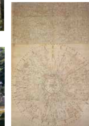
6, 天之図（星図） 「古利 瀧谷寺」より転載