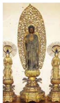
2. 称念寺木造阿弥陀三尊立像