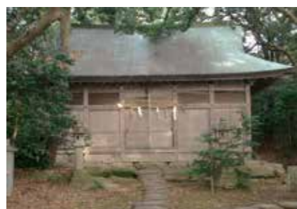
1, 大湊神社本殿・拝殿

5, 幅約 35cm、奥行約 35cm、高さ約 30cm の高麗狗型の獅子頭で、彩色がされています。詳しい時期は不明ですが、作風から室町時代の作の可能性ががあります。