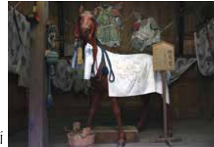
3, 三國神社木造神馬像