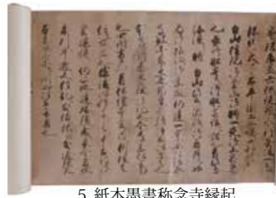
5. 紙本墨書称念寺縁起