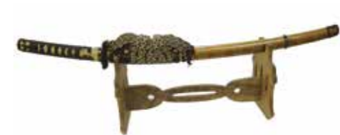
2, 木立神社奉納太刀銘守次