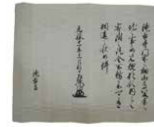
7, 瀧谷寺文書・聖教