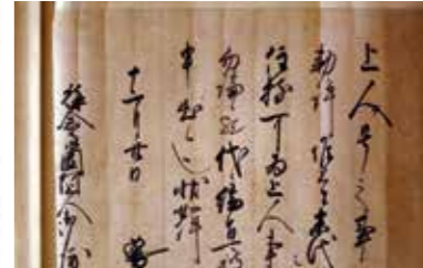
6. 称念寺所蔵勅書・繪旨