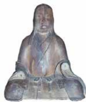
3, 大湊神社木造女神坐像