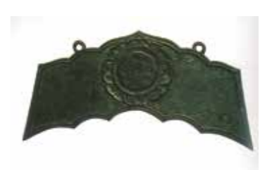
5, 金銅宝相華文磬