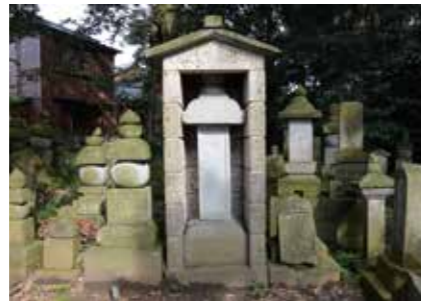
2, 竹内藤右衛門の墓と韃靼漂流碑