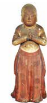
2, 称名寺木造聖徳太子像