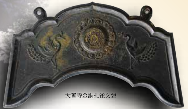
大善寺金銅孔雀文啓