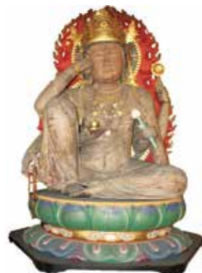
1. 木造如意輪観音菩薩坐像

1, 鎌倉時代に作られた、寄木造りの仏像です。如意輪観音菩薩像ではまれに見る大きさで、像高は162.1cmあります。 2, 唐破風の屋根を持つ一間一戸の平唐門で、朱が塗られています。この門は福井城三の丸にあった東照宮唐門の可能性が高いと考えられています。